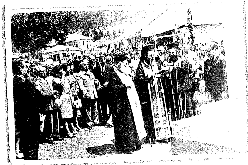
Φωτογραφικά στιγμιότυπα από τα αποκαλυπτήρια της προτομής στη Σαμαρίνα τον Αύγουστο του 1968